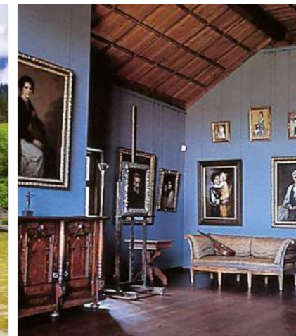
» In der Kaulbachvilla