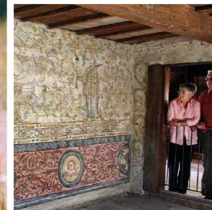
» Im Freilichtmuseum Glentleiten