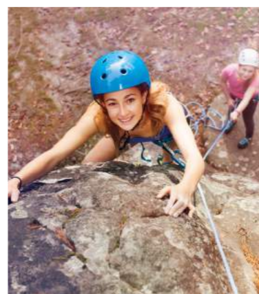
» Klettergarten Veste Schaumburg in Ohlstadt