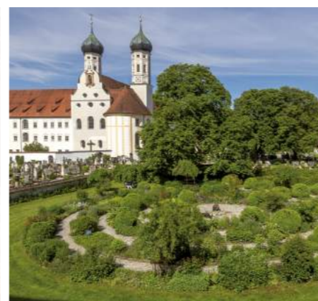
» Meditationsgarten Kloster Benediktbeuren