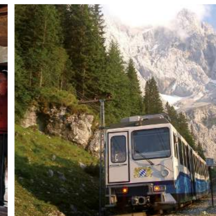
» Die Zugspitz-Zahnradbahn