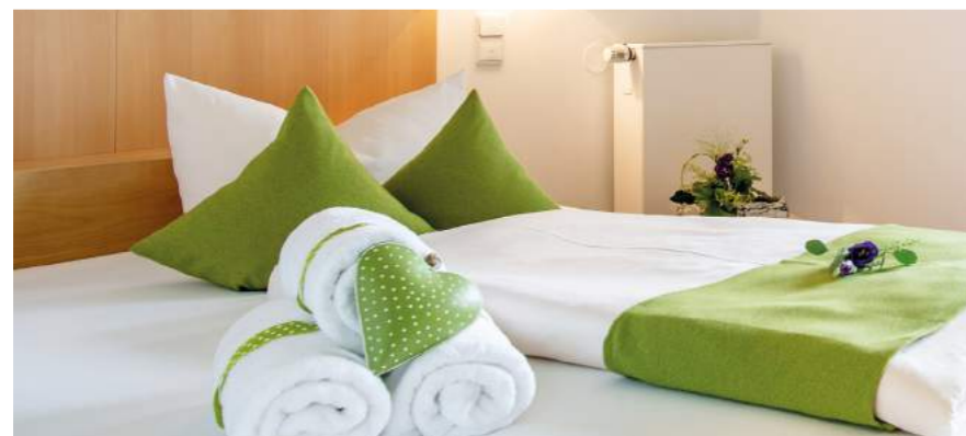
» Moderne Wohlfühlzimmer