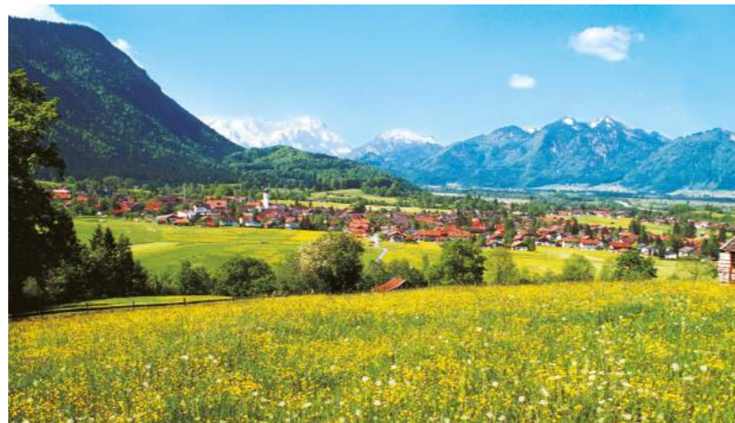
» Blick nach Ohlstadt

Der malerische Ort hat sich seine Ursprünglichkeit und das gelebte Brauchtum bewahrt und liegt mitten im Herzen einer der schönsten Landschaften Deutschlands. Ideal ist die Nähe zu besonderen Sehenswürdigkeiten wie das Schloss Linderhof, die spektakuläre Partnachklamm oder das Franz-Marc Museum, und doch gleichzeitig ruhig und abseits der Touristenströme.