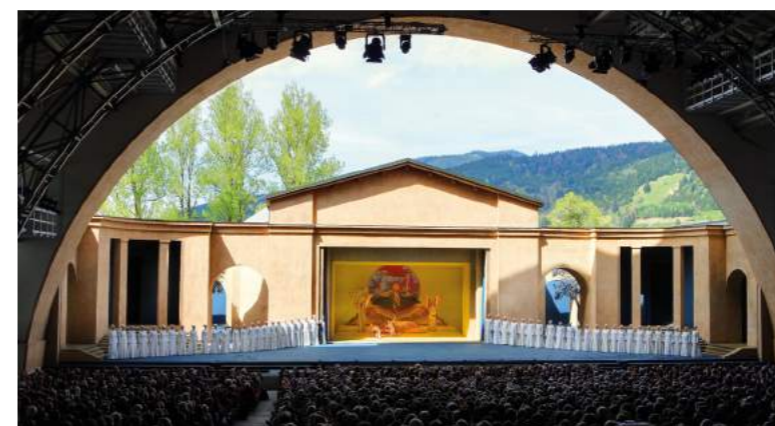
» Das berühmte Passionstheater in Oberammergau