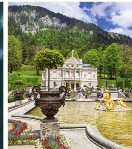
» Schloss Linderhof