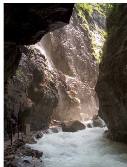
» Die Partnachklamm