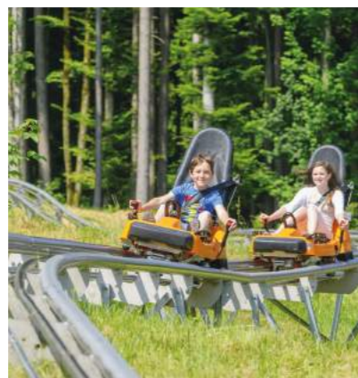
» Die Sommerrodelbahn Oberammergau

Direkt vom Hotel aus lassen sich wunderschöne Wander-, Fahrrad- und im Winter auch Langlauf Touren von beschaulich bis anspruchsvoll unternehmen. Ob Sie es sportlich mögen, auf Natur und Erholung Wert legen oder eher neugierig auf die kulturellen Schätze der Region sind, hier sind Sie in jedem Fall richtig – zu jeder Jahreszeit.